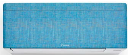
Värikäs kangas, valkoinen runko