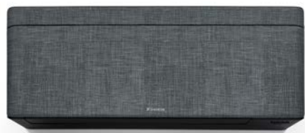
Harmaa kangas, musta runko