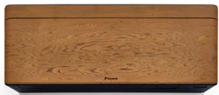
Tumma puu, musta runko