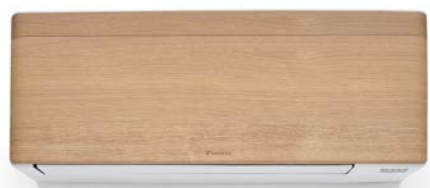
Vaalea puu, valkoinen runko

Design-vaihtoehdot täydentävät nykyisiä valkoisia ja mustia Stylish-malleja ja antavat mahdollisuuden valita laitteen ulkonäkö juuri sinun kotisi sisustukseen sopivaksi. Pinnat on suunniteltu muistuttamaan luonnonmateriaaleja, kuten vaaleaa tai tummaa puuta, tummanruskeaa nahkaa ja harmaata tai värikästä kangasta.