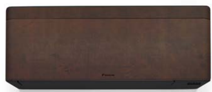
Tumma nahka, musta runko