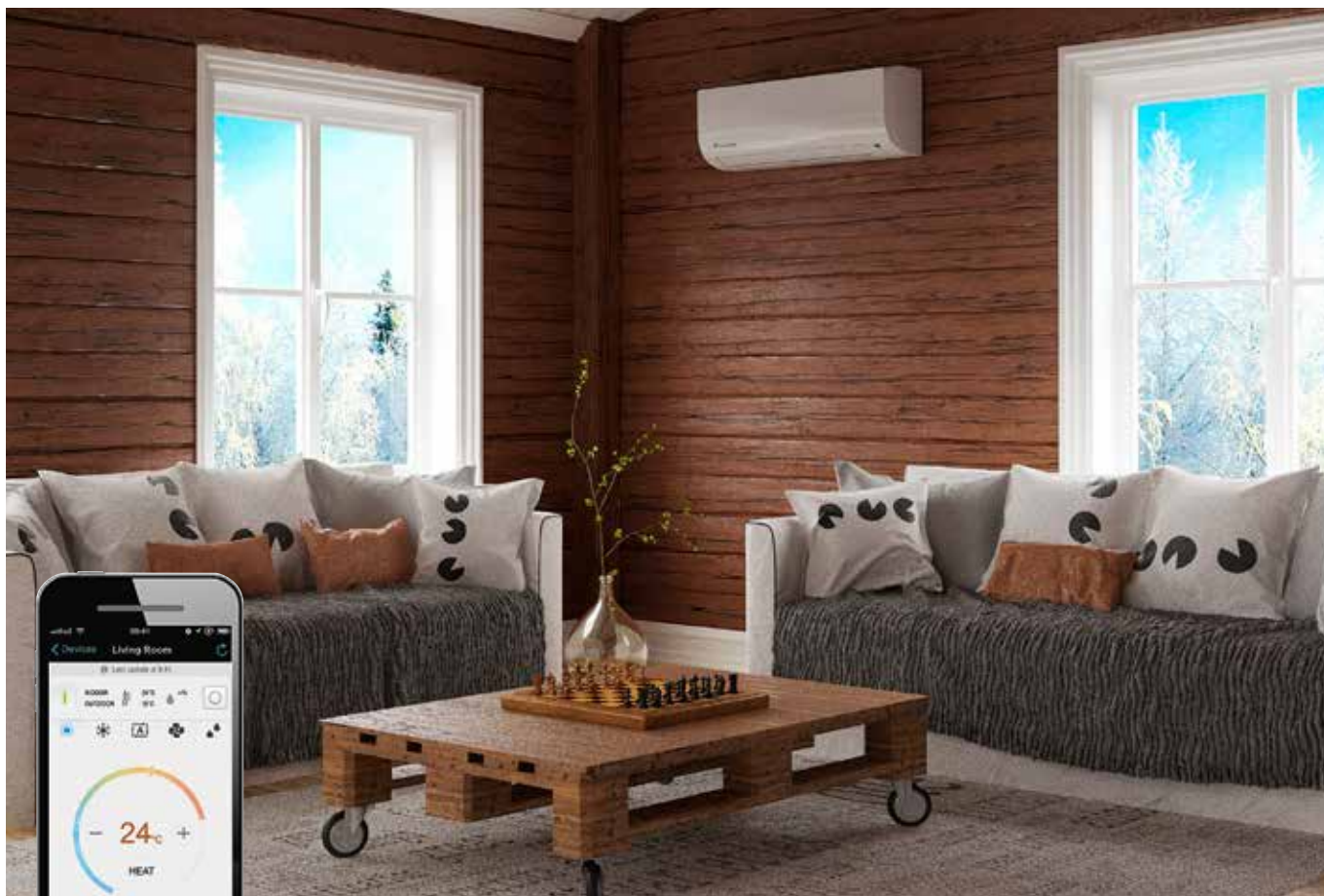
Daikin Comfora -ilmalämpöpumppu sopii hyvin myös mökin lämmitykseen ja peruslämmön ylläpitoon.